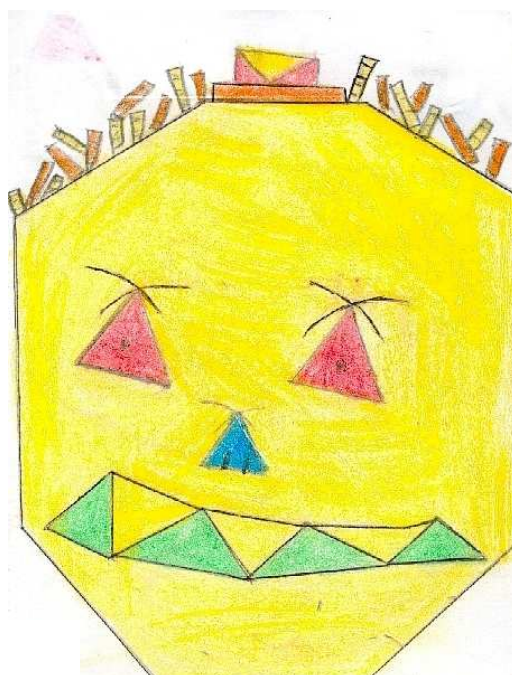
Illustration de Jean