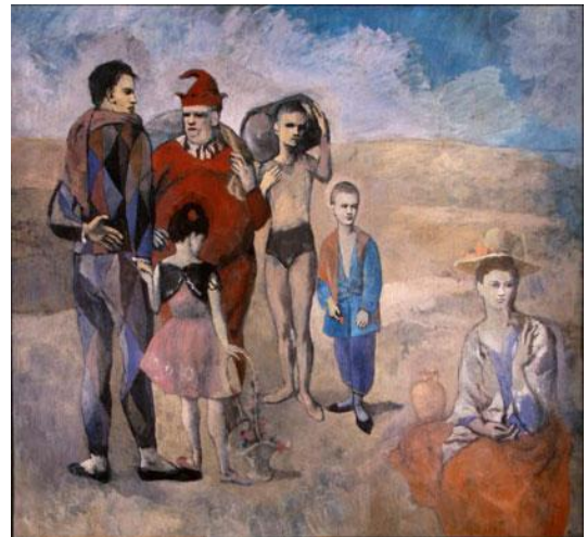
Famille de Saltimbanques de Picasso (1905)