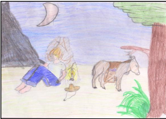
Illustration de Rim