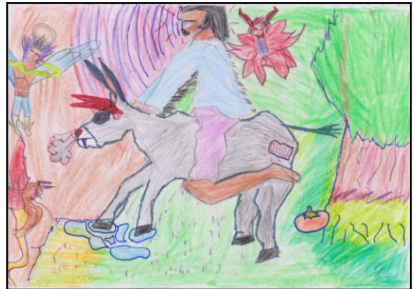
Illustration de Mohamed Amine