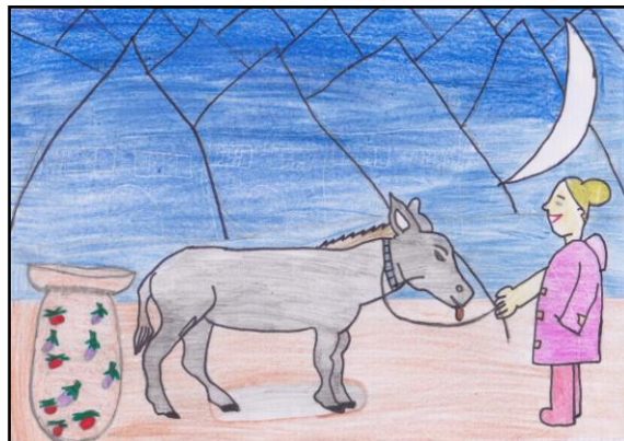
Illustration de Zineb