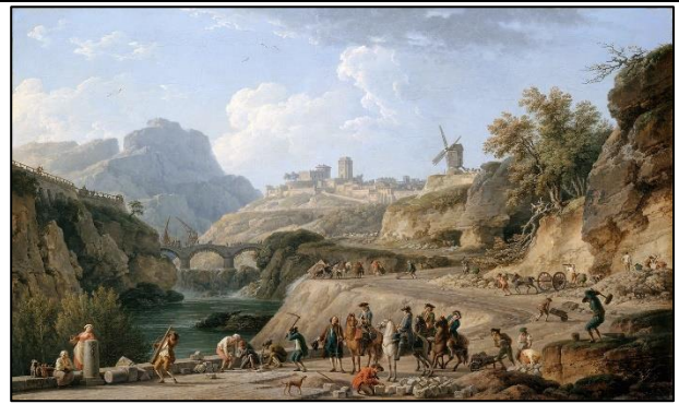
La construction d'un grand chemin, Joseph Vernet, 1774