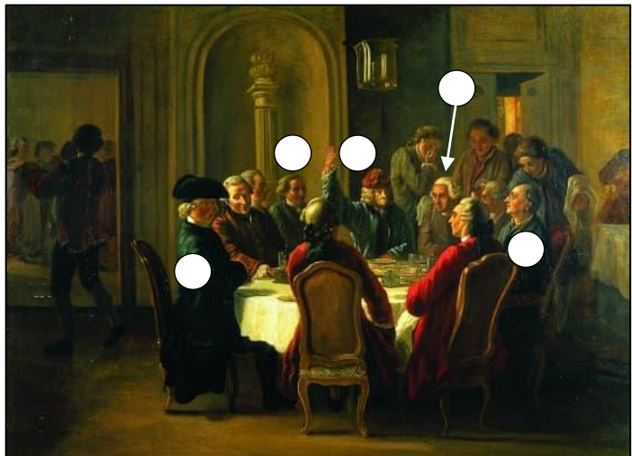
Le dîner des philosophes, Jean Hubert, 1772

À Ferney, près de la frontière suisse, Voltaire reçoit ses amis philosophes. Ils échangent leurs idées et évoquent les grands problèmes de leur temps. Ils s'insurgent par exemple contre les pratiques indignes de leur siècle comme la torture ou l'esclavage et s'élèvent contre l'intolérance politique et religieuse. Ils dénoncent les injustices de la société et parlent de liberté et d'égalité. L' Encyclopédie , œuvre monumentale, rassemble tous les aspects de la pensée du XVIII ème siècle.