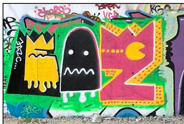
Mur sous un point dans la commune du Mesnil le Roi.