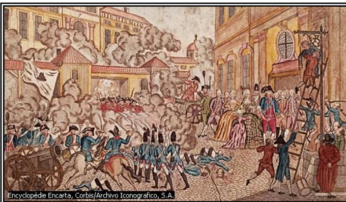
La prise des Tuileries : Une insurrection populaire met fin à la monarchie. La 1 ère République est proclamée.