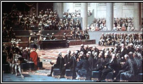
La réunion des États Généraux : Les députés du Tiers État entrent en conflit avec les autres députés.