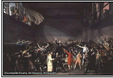
Le serment du Jeu de Paume : Des députés élaborent une Constitution.