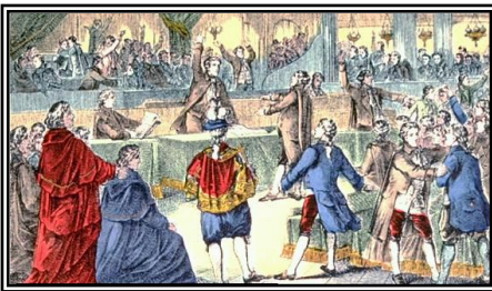
L'abolition des privilèges : Les nobles et le clergé perdent leurs droits.