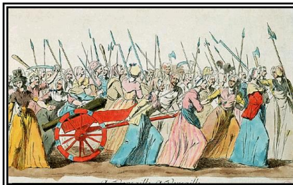
Émeutes des Parisiennes : Elles marchent sur Versailles et ramènent la famille royale à Paris.