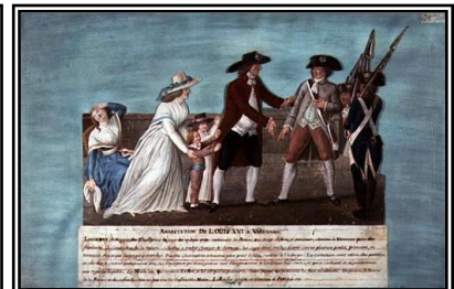
La fuite à Varennes : La famille royale tente de s'enfuir en Prusse mais elle est arrêtée.