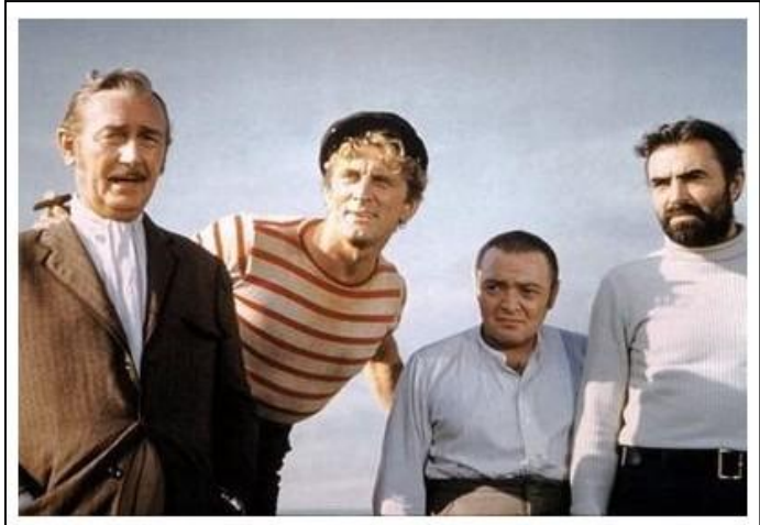
De gauche à droite : Paul Lukas (le professeur Aronnax), Kirk Douglas (Ned Land), Peter Lorre (Conseil) et James Mason (le capitaine Nemo). Vingt mille lieues sous les mers de Richard Fleischer, Oscar des meilleurs effets spéciaux en 1955.